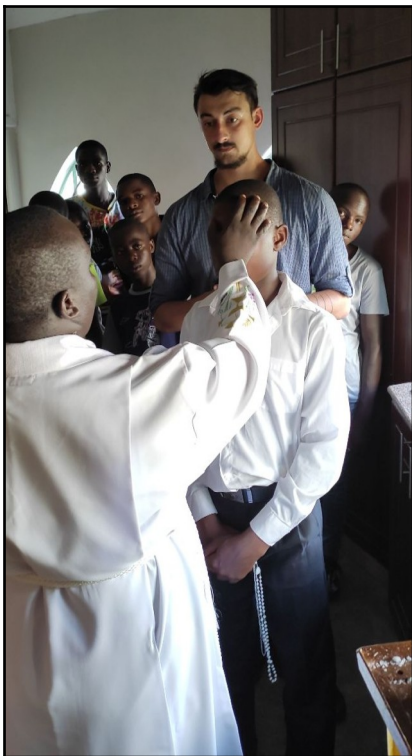
Timo sa stal krstným otcom.

Tak isto patrí vďaka všetkým ľuďom dobrej vôle, ktorí nás akýmkoľvek spôsobom podporujú. ĎAKUJEME.