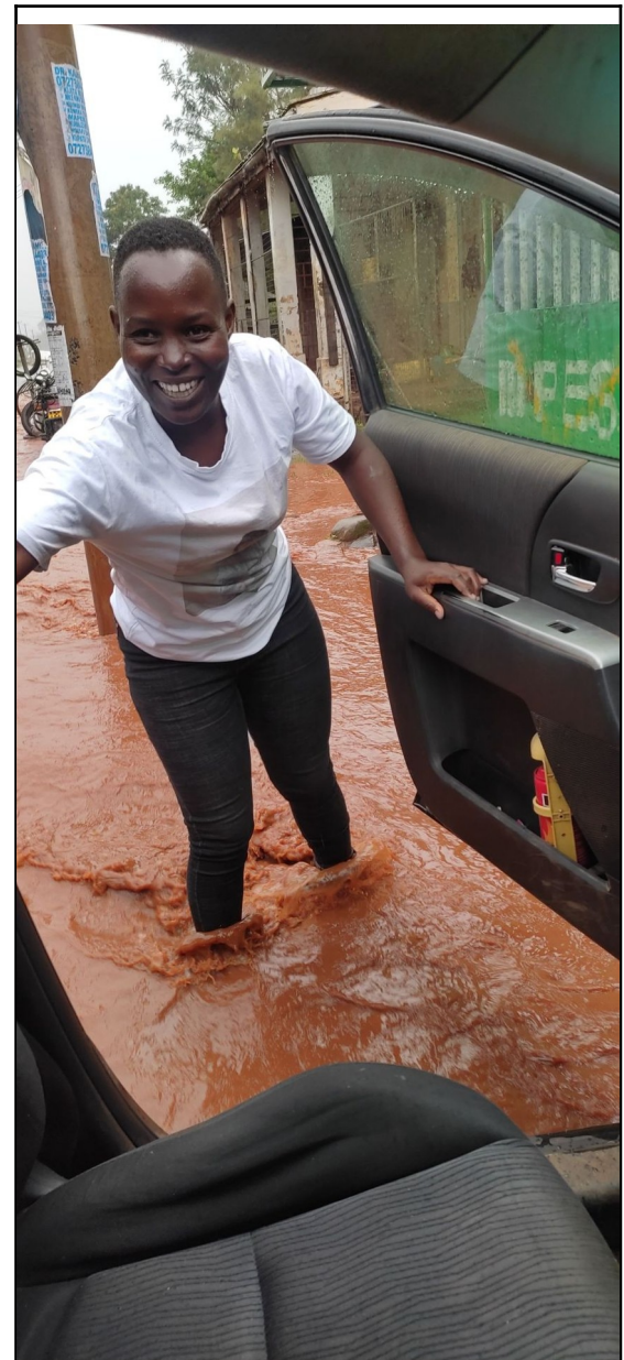
Keď za 10min naprší tolko ako za celý den.