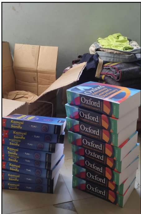
Knihy pre stredoškolakov.