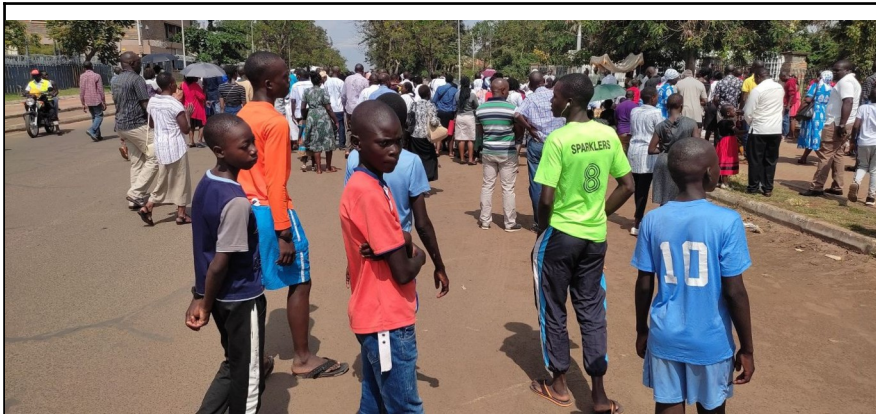
Procesia Božieho tela v Kisumu.