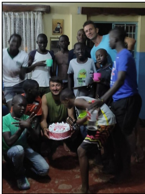
Timov posledný večer pred odchodom.