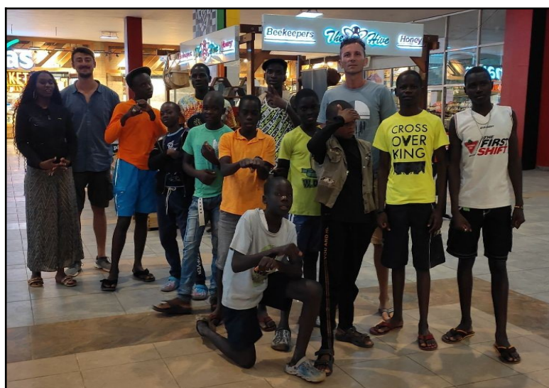
1.jún. Den deti. Išli sme do kina na TOP GUN.