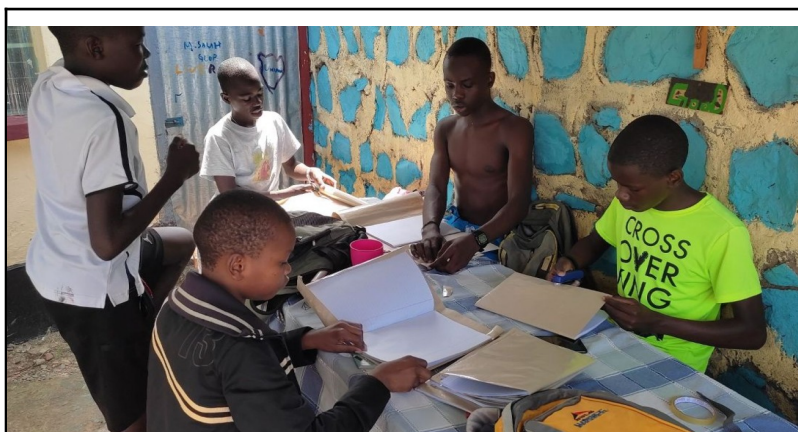
Príprava do školy.