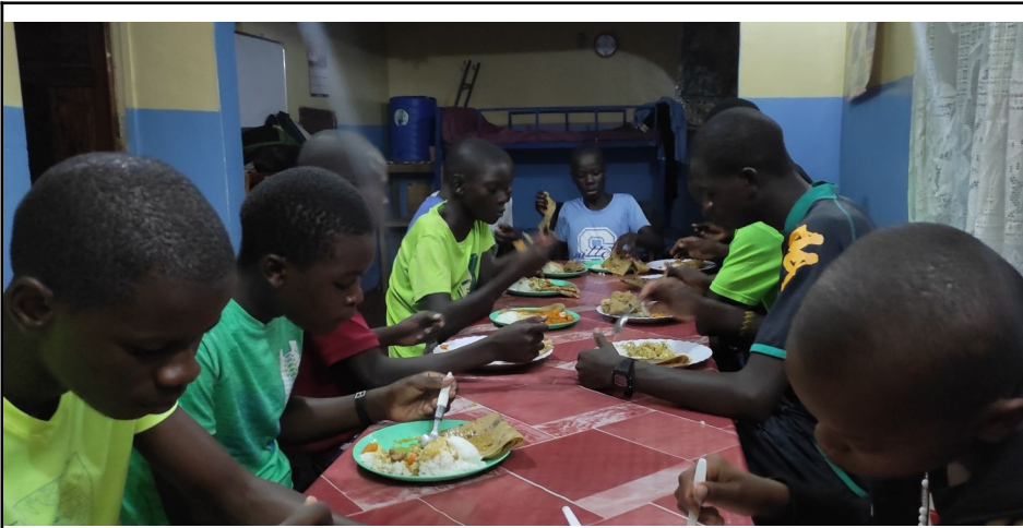
26.Máj.Patron nášho centra -sviatok Filipa Neriho