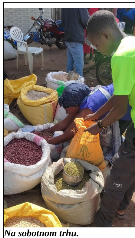
Na sobotnom trhu.