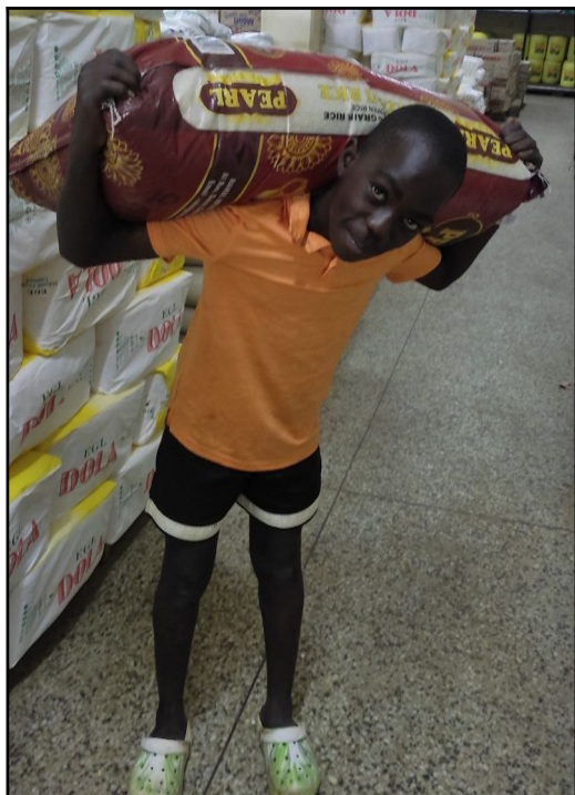
Jacton a 50kg ryže