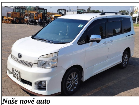
Naše nové auto