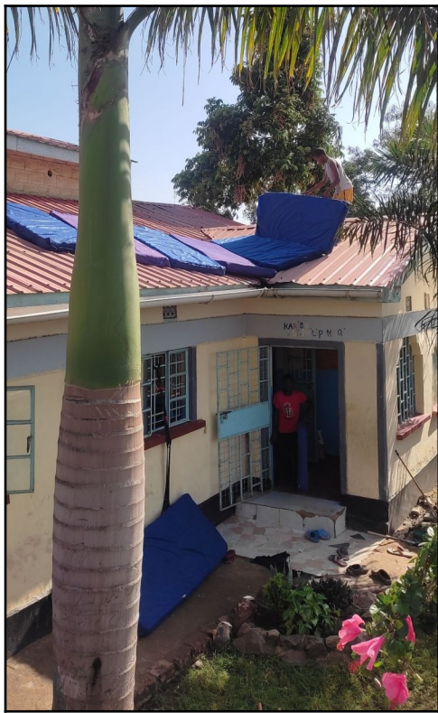
Madrace treba dat' občas aj na slnko.