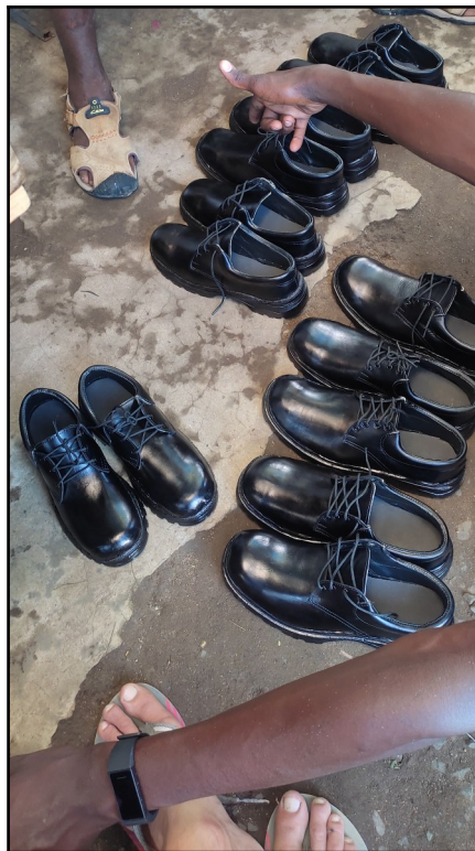
Nové topanky do školy.