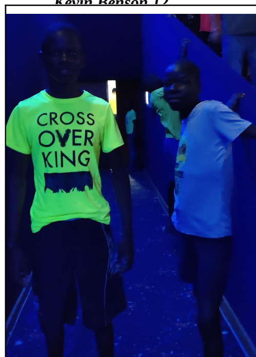
V kine sme boli len mi. :)