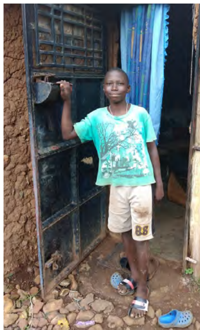
Na domácej návšteve u Habathoi