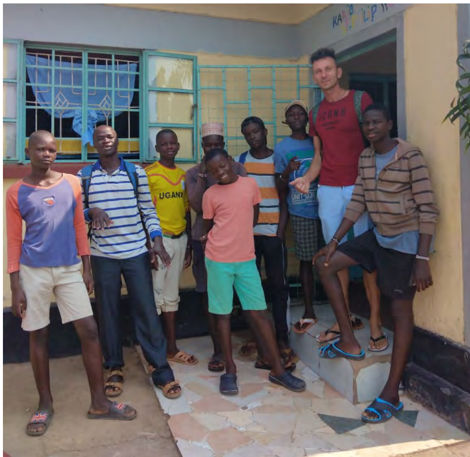
Rozlúčková fotografia pred cestou na dovolenku