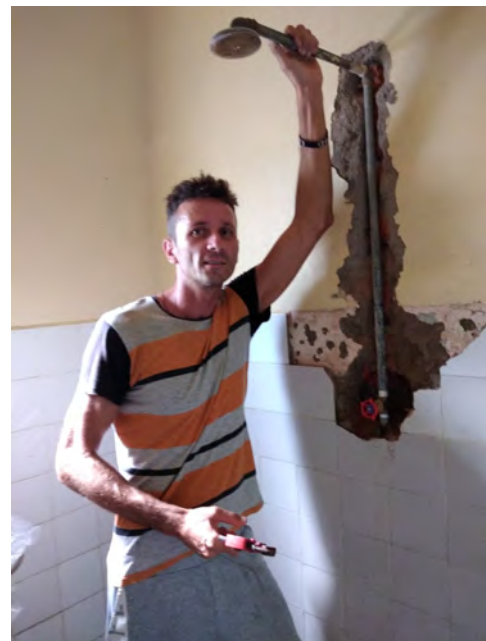
Drobné opravy v centre