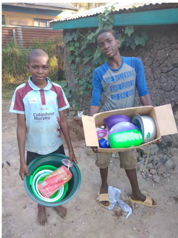
Kúpili sme veci do domácnosti