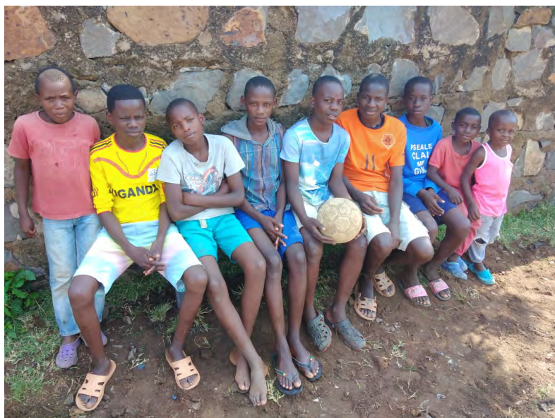
Pred naším centrom