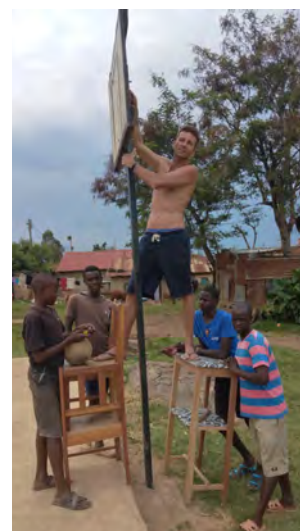
Montáž basketbalovej dosky