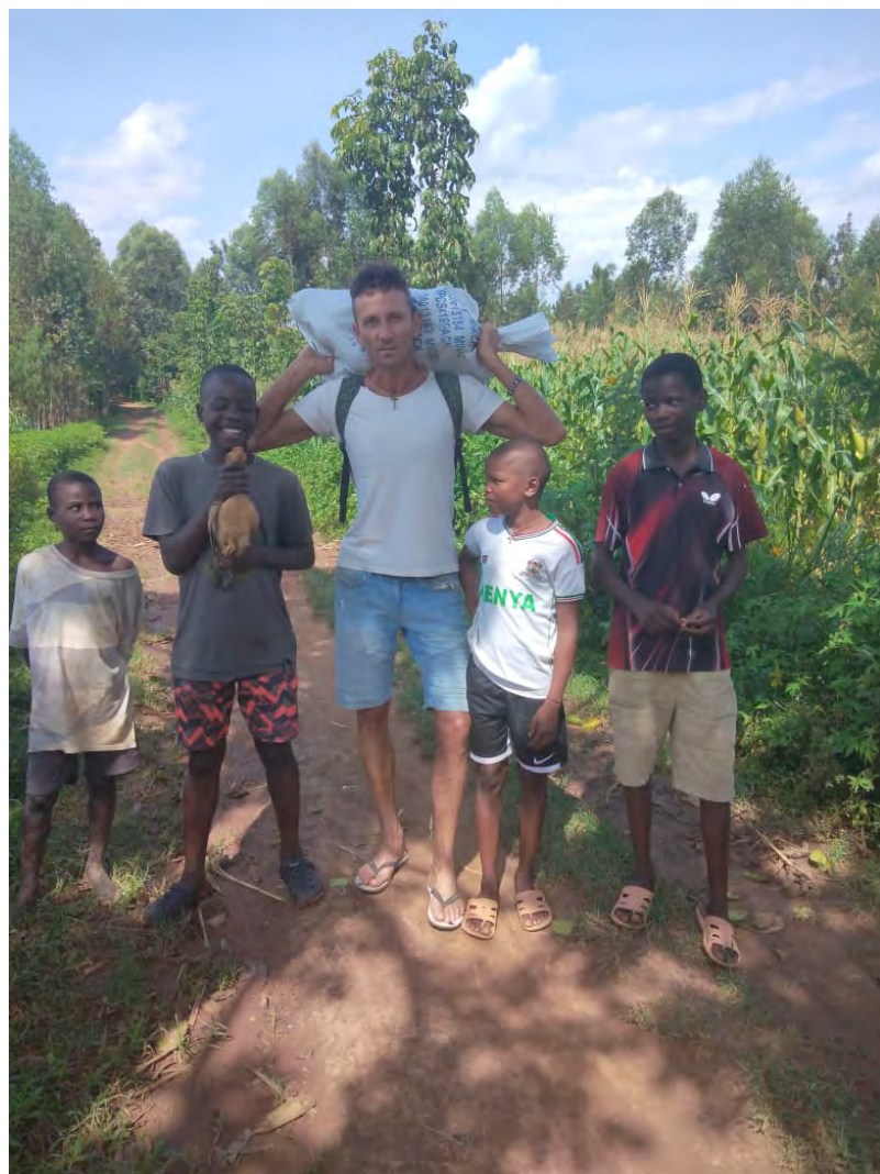
Ideme z návštevy. Dostali sme mech avokada