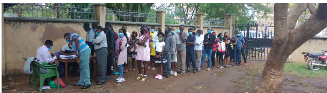
Ľudia čakajúci na registráciu do kostola.