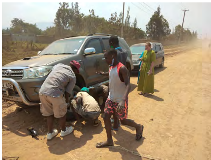
Pomoc na ceste