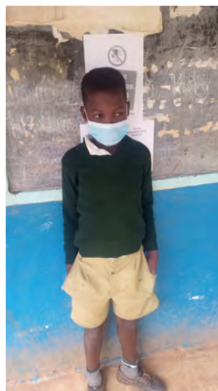
Na návšteve v škole - 4. trieda