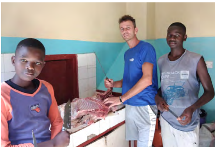
Kúpili sme svinku - cca.25kg