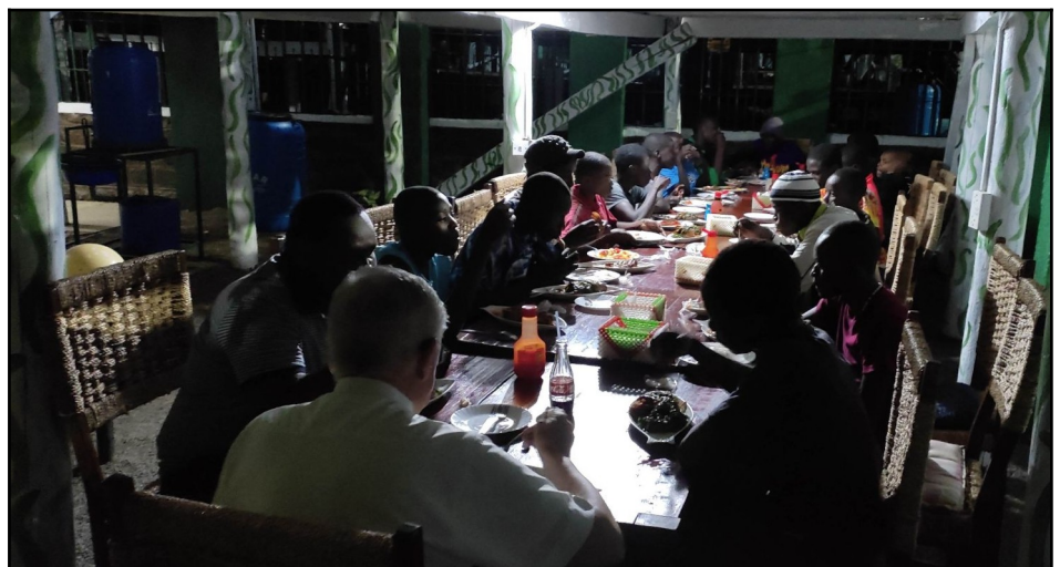
Father Corner nás pozval všetkých na večeru.