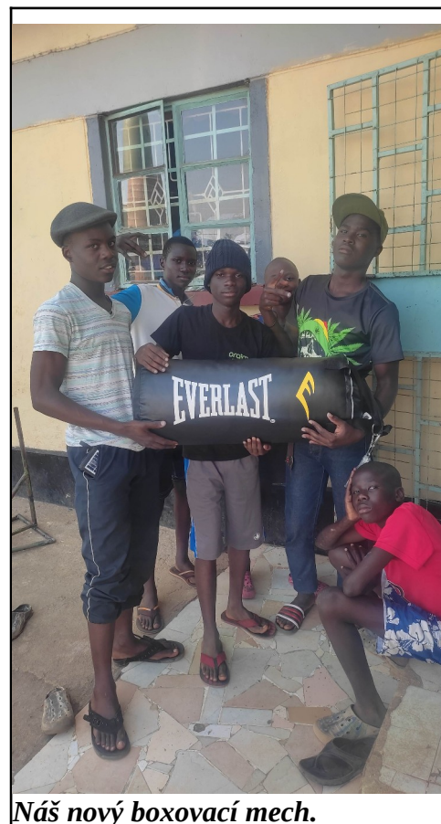
Náš nový boxovací mech.