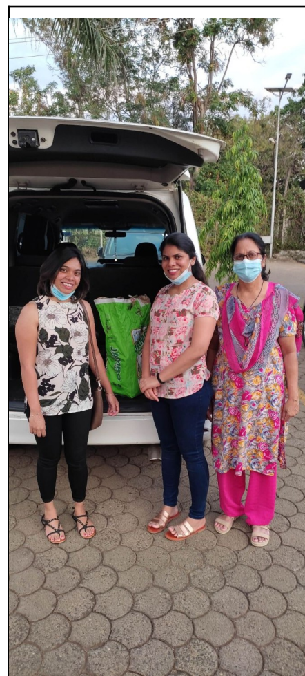
Naší Kensko-Indický potporovatelia. Dali nám ryžu, múku, olej.