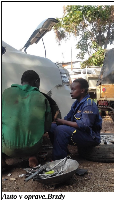
Auto v oprave. Brzdy