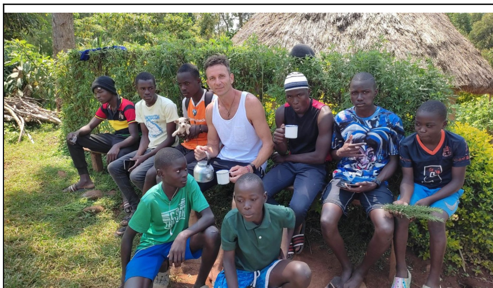
Cerstve mlieko v Nandi hills. Tu sa rodia najlepší bežci v Keni a na svete.