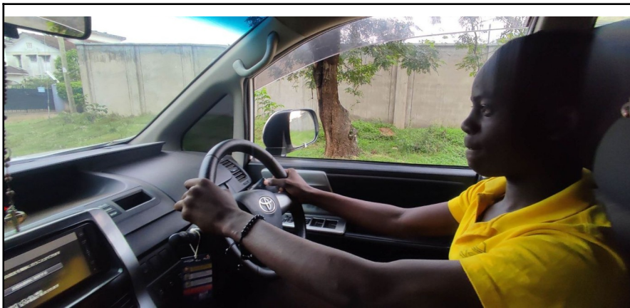
Učíme sa jazdit.