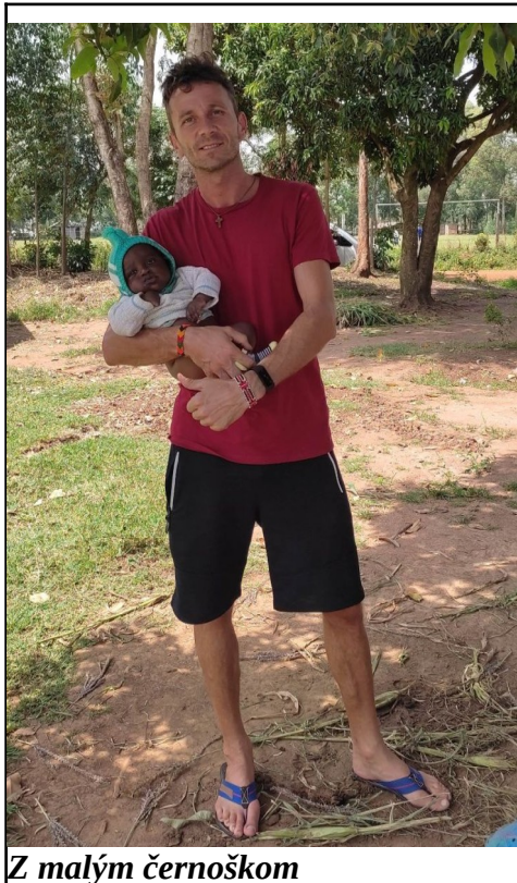
Z malým černoškom