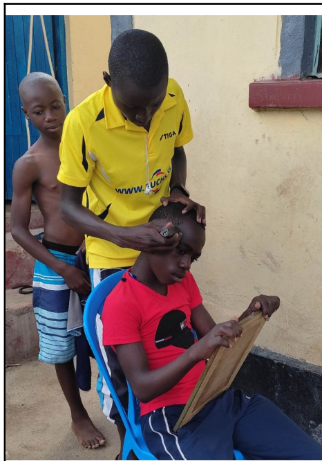
Chlapci sa strihaju.