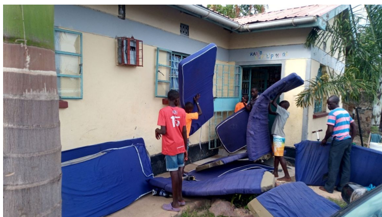
Dezinfekcia matracou od blch.