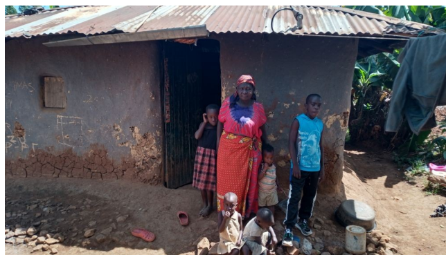
Jackton a jeho starenka.