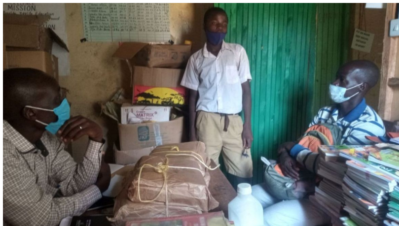
Riaditeľna v Základnej škole. Platíme školne.