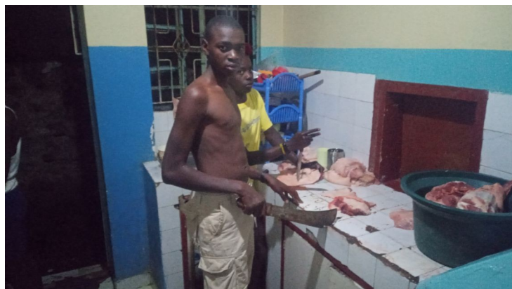
Kúpili sme 25kg svinu