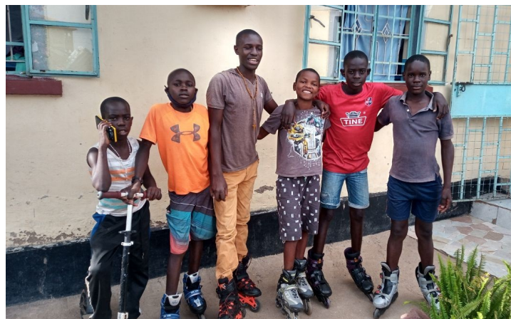
Máme nové koliečkové korčule zo Slovenska.