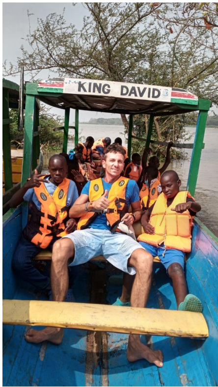
Nedela-Išli sme na loď.