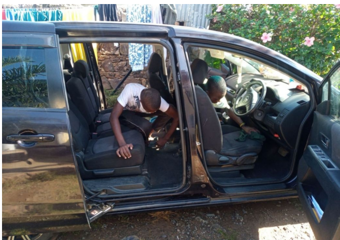
Cistenie auta a dom na dedine.