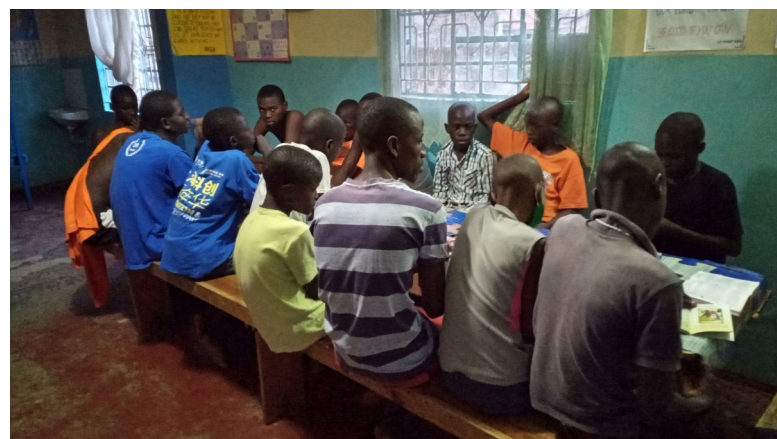
Večerná modlitba ruženca.